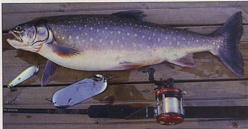
Olika former av attraktorblänken är viktiga detaljer för djupfisket efter röding. Denna skönfläckiga Sommenfisk föll för ett skeddrag bakom en liten dodger.

Man hör ofta poängteras hur viktig trollingfarten är. Jag anser att