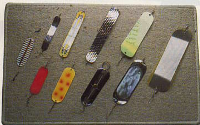
Dodger och flashers från minsta till största storlek i olika färgkombinationer. Notera den holografiska bilden av ett sillstim i dodgern längst till höger i nedre raden.

Det är viktigt att man inte planlöst släpfiskar olika lockblänkskombinationer. Ett effektivt släpsystem kan byggas upp genom att linlängderna justeras i förhållande till varann utan risk för trassel när båten svänger och betena ökar eller mins-